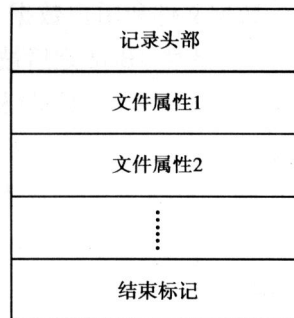
图 3 文件记录的内部结构

此外,为了方便管理非常驻数据,NTFS文件系统把分配给它的数据运行所包含的簇按顺序从 0开始依次编号,并将该信息记录在非常驻属性的头部,称之为虚拟簇号(Virtual Cluster Number, VCN)。VCN不同于 LCN,前者针对特定的空间分配,且不要求在物理上连续,而后者则针对整个 NTFS分区,且在物理上连续。